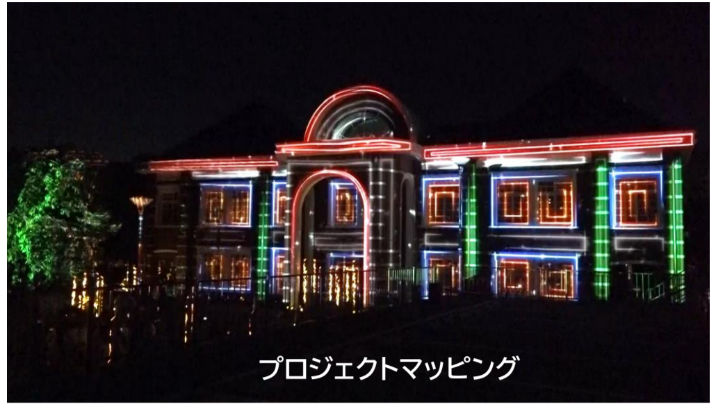
プロジェクトマッピング

会場は、エア遊具のブースやお絵描き体験ブース、水産高校の生徒の皆さんによる出張ミニ水族館など子供たちが楽しめるコーナーがたくさんありました。